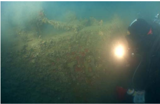
nápis T8 na zádi