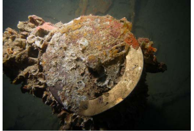
stojan kormidelního kola